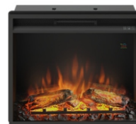
Klar z wkładem 23' TG