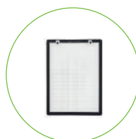
Filtr HEPA 1 szt. Kod produktu: F2-AP168W Kod EAN: 5902605402690