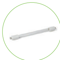
Lampa UV do oczyszczacza 1 szt. Kod produktu: AP-UV Kod EAN: 5902605402683