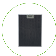
Filtr wstępny 1 szt. Kod produktu: F1-AP168W Kod EAN: 5902605403789